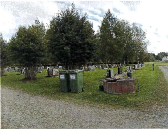
Uudella hautausmaalla lajitteluastiat, kaivo luonnon kasteluvudelle ja kaunis puusto.

E-Ympäristöpalvelut Pohjanmaa Oy / Niuro-Yhtiöt Oy