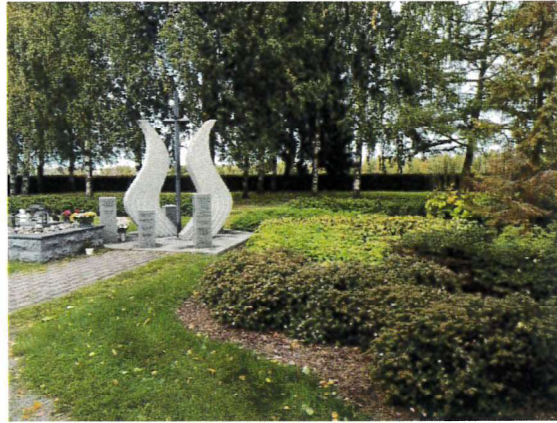
Uuden hautausmaan Muistolehto ja sirottelupaikka perennoineen