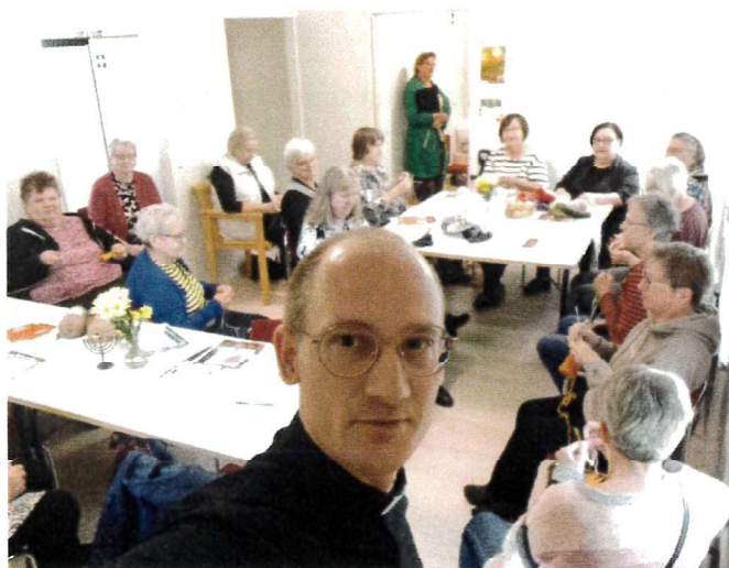
Erittäin aktiivista vapaaehtoistoimintaa diakonian käsityöpiirissä